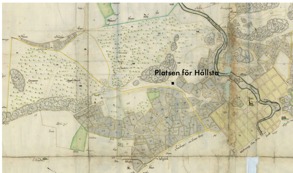
Fig. 3: Detalj ur 1696 års karta över Nyköping stadsjordar. Platsen för Hållsta enligt häradskartan från 1897–1901 (LSA C57-1:6 och RAK 56:5).

tig Karl. 73 Staden Vadstena växte fram i anslutning till klostret under andra halvan av 1300-talet, och erhöll stadsprivilegier år 1400. 74 Klostret anlades på mark som hade tillhört en kungsgård eller en huvudgård för Folkungaätten, vilken donerades av kung Magnus Eriksson och drottning Blanka i fundationsdonationen till klostret år 1346. 75 I jordeböckerna från mitten av 1500-talet framkommer att Vännestad var en by med nio gårdar samt en ödegård, vilka samtliga tillhörde Vadstena kloster i slutet av medeltiden. 76 Byn hade enligt en räfsteingsdom år 1399 även den blivit skänkt av kung Magnus och drottning Blanka till klostret. 77 Även i fallet Vendestad är det alltså fråga om ett tillägg till staden som har skett efter medeltiden genom kronans försorg, då kronan kommit i besittning av byn efter kyrkoreduktionen vid mitten av 1500-talet.