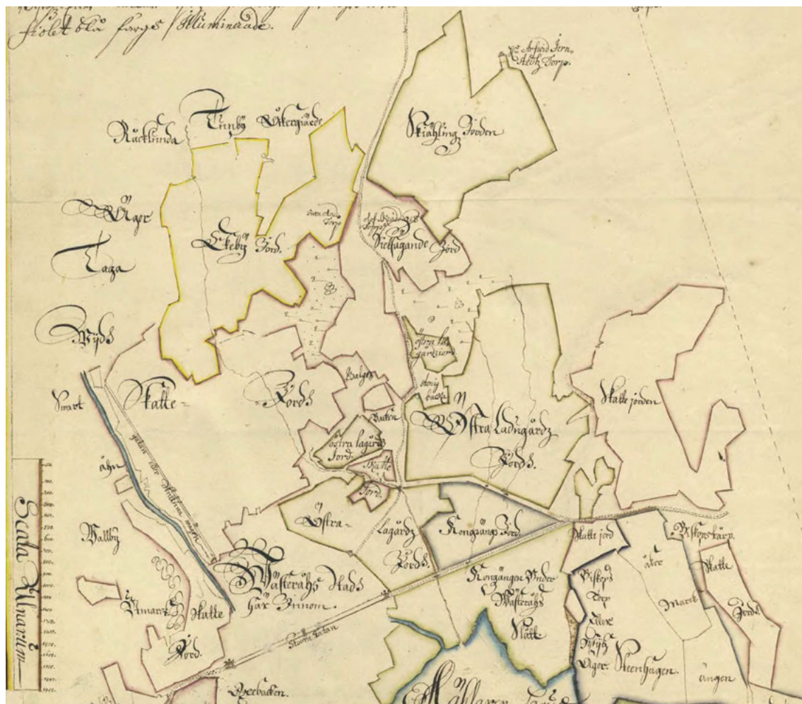
FIGUR 1: Detalj ur kartan över Västerås stadsjordar från slutet av 1600-talet. Ekebyjorden är markerad med gula gränser på kartan på stadsjordens nordvästra del. Källa: LSA T72-1:3.